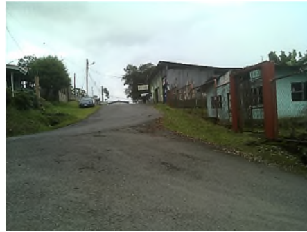
Vista general de ruta nacional hacia Santa Teresita centro y escuela (derecha)