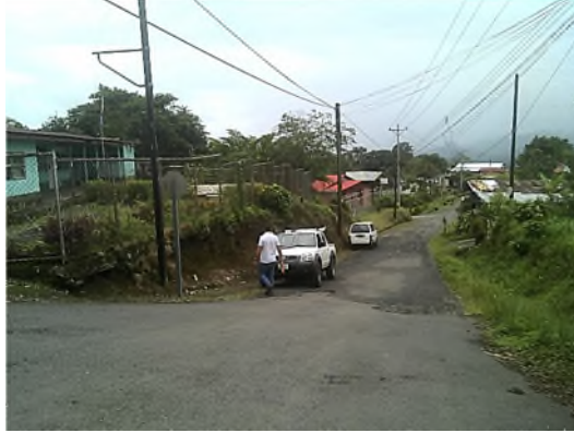
Vista general de calle a Peralta y escuela (a la izquierda)