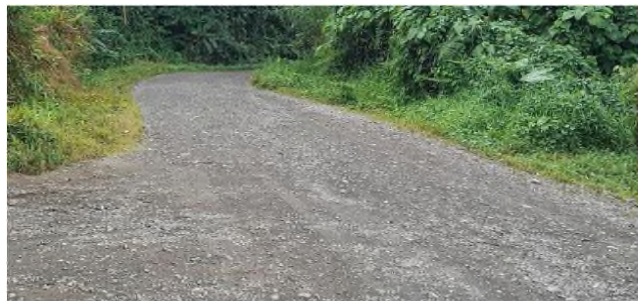
Fotografía N°2: sectores de superficie de ruedo en lastre.