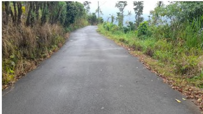
Fotografía N°3: trabajos en carpeta asfáltica realizados en última intervención.