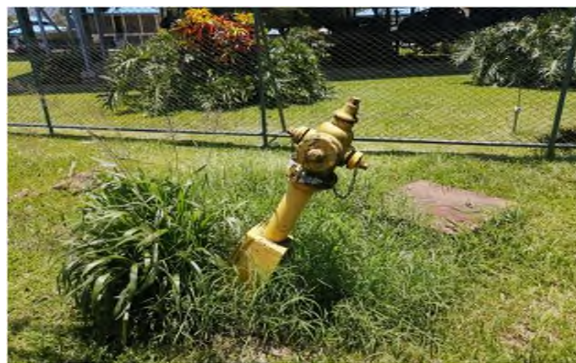
Hidrante Univalvular instalado frente a la Sede del Atlántico UCR, que debe ser sustituido por hidrante multivalvular