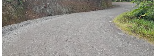
Fotografía N°1: sectores de superficie de ruedo en lastre.

con presupuesto proveniente de la Ley N°8114 y no se encuentra programado para el año 2022 dentro del plan vial quinquenal aprobado por el Concejo Municipal y Contraloría General de la República.